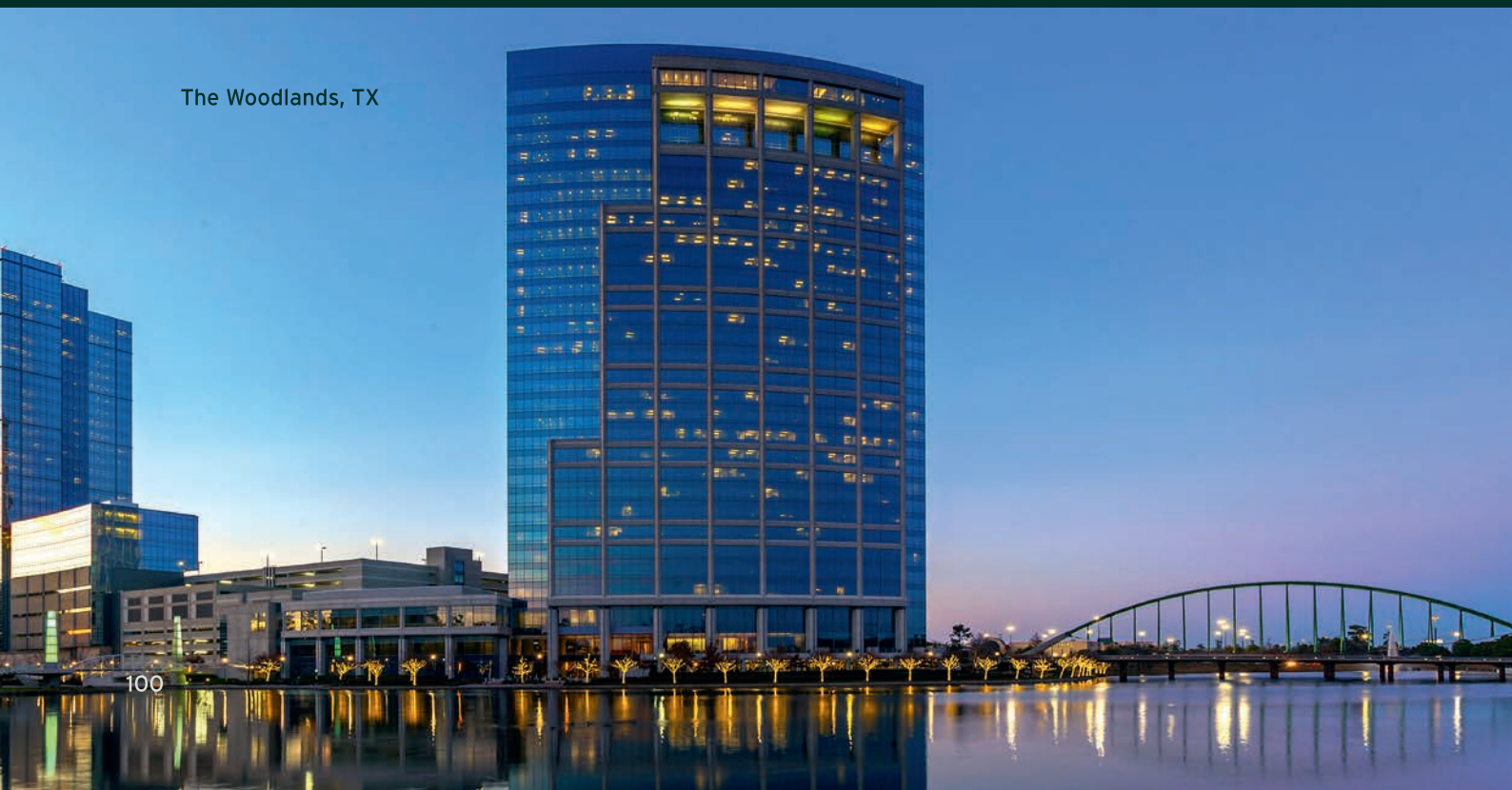
The Woodlands, TX