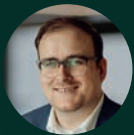
Autor Julian Banse